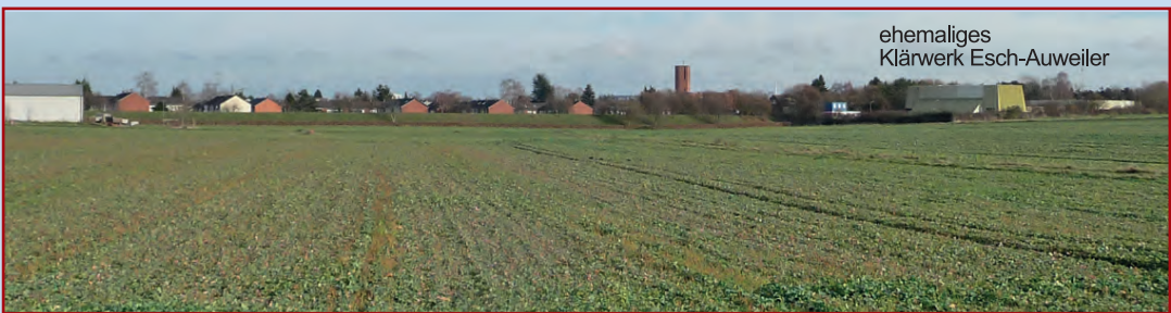
Blick von Westen auf Rheinrinne, Escher Kanal und Esch; Aufnahme vom 7. Dezember 2009

Hier, nördlich der Orrer Straße, mündet der Escher Kanal, der von den Kölner StEB betrieben wird. Er lieferte früher das geklärte Abwasser aus den Klärwerken Esch-Auweiler und Pesch in den Randkanal.